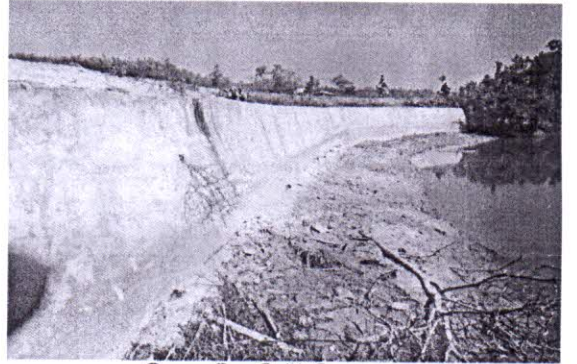
চিত্র-২: ব্রীক রিটেইনিং ওয়াল।