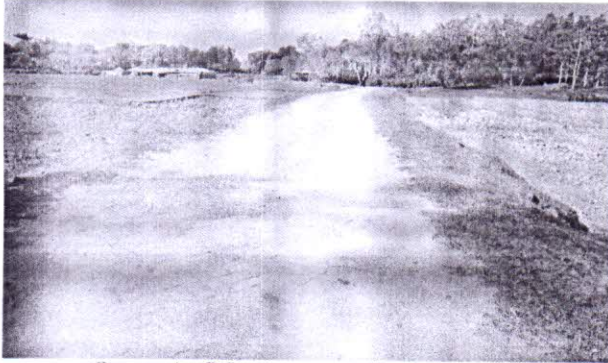
চিত্র-১: এইচবিবি সড়কের শুরুরদিকের একাংশ।

২২. প্রকল্প পরিদর্শনের স্থির/ ভিডিও চিত্র ও বর্ণনা: