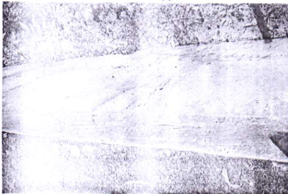
চিত্র-৩: আর সি সি রিটেইনিং ওয়াল।