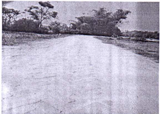
চিত্র-৪: এইচবিবি সড়কের শেষদিকের একাংশ।