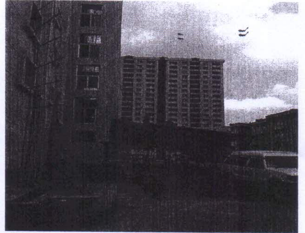
প্রকল্পের আওতায় নির্মিত ভবনসমূহ