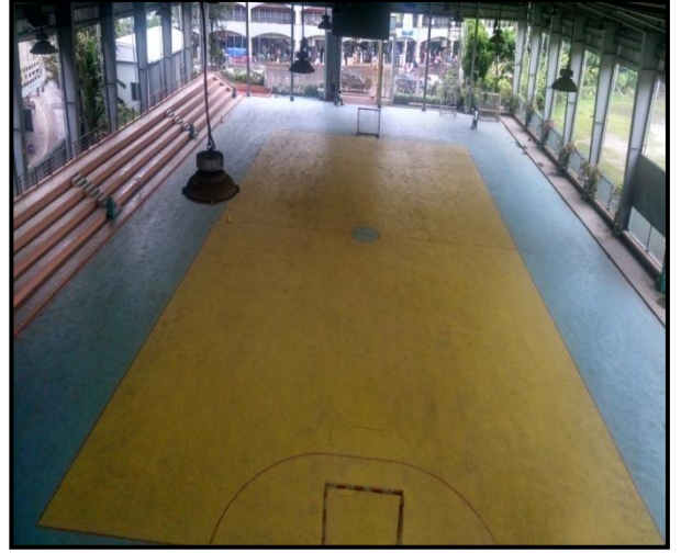
চিত্রঃ রোলার স্কেটিং কমপ্লেক্সের আওতায় নির্মিত গ্যালারিসহ মাঠের একাংশ।