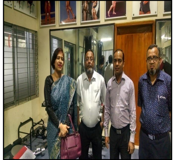
চিত্রঃ রোলার স্কেটিং কমপ্লেক্স পরিদর্শনকালে নির্মিত জিমে বাস্তবায়নকারি সংস্থার সংশ্লিষ্টদের সাথে।