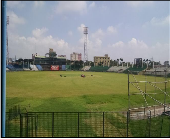
চিত্রঃ ফতুল্লা খান সাহেব ওসমান আলী ক্রিকেট স্টেডিয়ামের একাংশ।