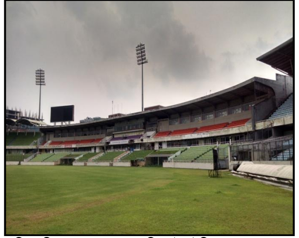
চিত্রঃ মিরপুর শেরে বাংলা ক্রিকেট স্টেডিয়ামের একাংশ।