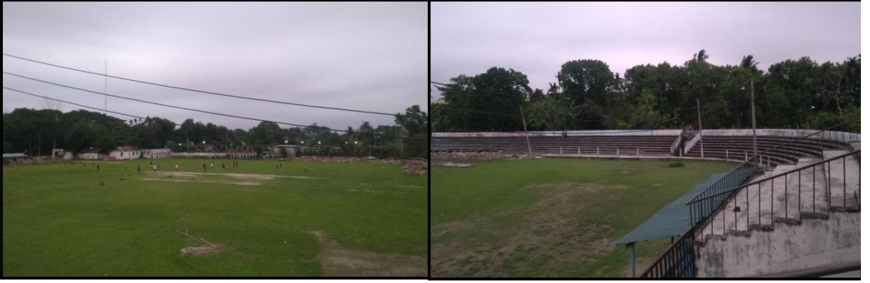
চিত্রঃ প্রকল্পের মাধ্যমে উন্নয়নকৃত বিদ্যমান খেলার মাঠ এবং সংস্কারকৃত বিদ্যমান গ্যালারির কিয়দংশ যা বর্তমানে ভেংগে ফেলা হবে।