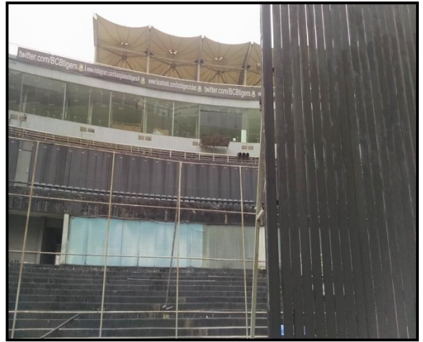
চিত্রঃ মিরপুরের ক্রিকেট স্টেডিয়ামে সংস্কারকৃত ট্রাইভিশন এবং ফ্রেম।