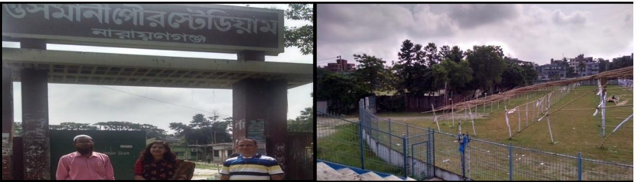
চিত্রঃপ্রকল্পের আওতাভুক্ত নারায়ণগঞ্জ জেলা স্টেডিয়াম পরিদর্শনকালে এবংনির্মিত সারফেস ডেন , গ্রীল ও গার্ড ওয়াল ফেন্সিং এর একাংশ।