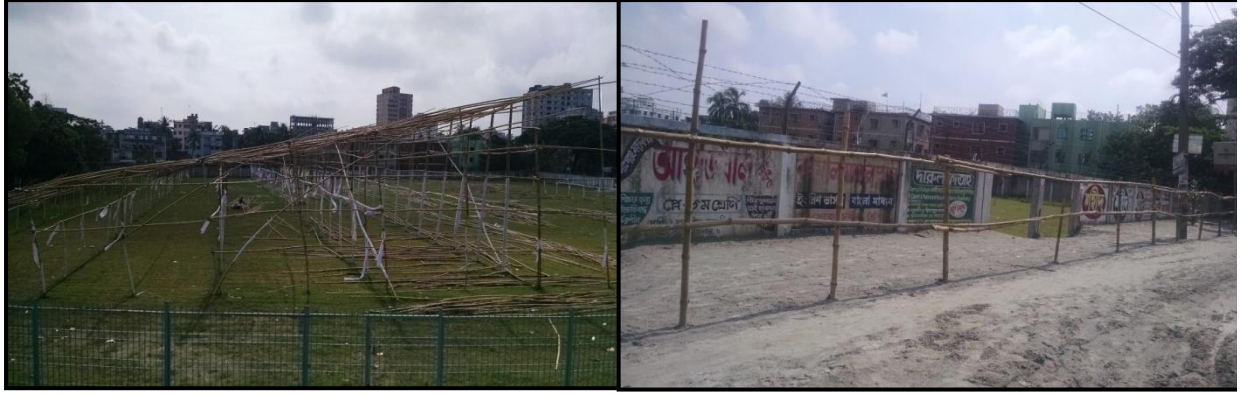
চিত্রঃ পরিদর্শনকালে নারায়ণগঞ্জ জেলা স্টেডিয়ামের মাঠের বর্তমান অবস্থা এবংসীমানা প্রাচীরের ভগ্নাংশ।