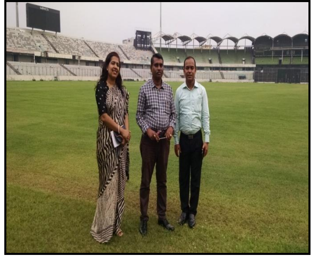
চিত্রঃ মিরপুর শেরে বাংলা ক্রিকেট স্টেডিয়াম পরিদর্শনকালে।