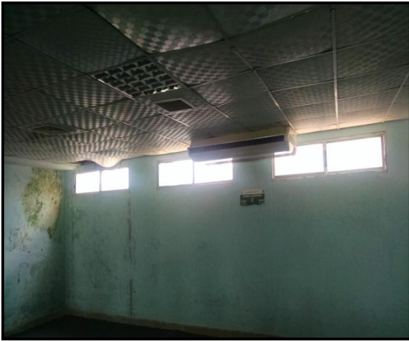
চিত্রঃ ফতুল্লা স্টেডিয়ামে সংস্কারকৃত কাজের বর্তমান অবস্থা ও সংগৃহীত এসি।