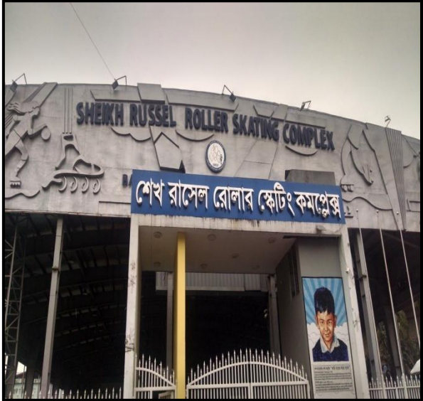
চিত্রঃ রোলার স্কেটিং কমপ্লেক্সের প্রধান প্রবেশ ফটকের একাংশ।