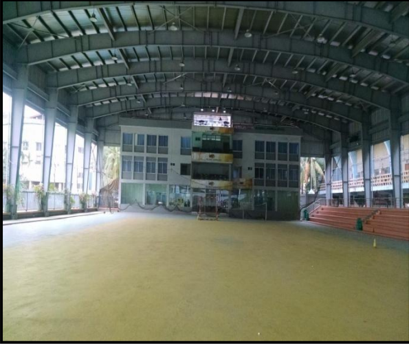
চিত্রঃ রোলার স্কেটিং কমপ্লেক্সের আওতায় নির্মিত প্যাভিলিয়ন ভবন ও প্রি ফেব্রিকেটেড স্টীল সেডের একাংশ।