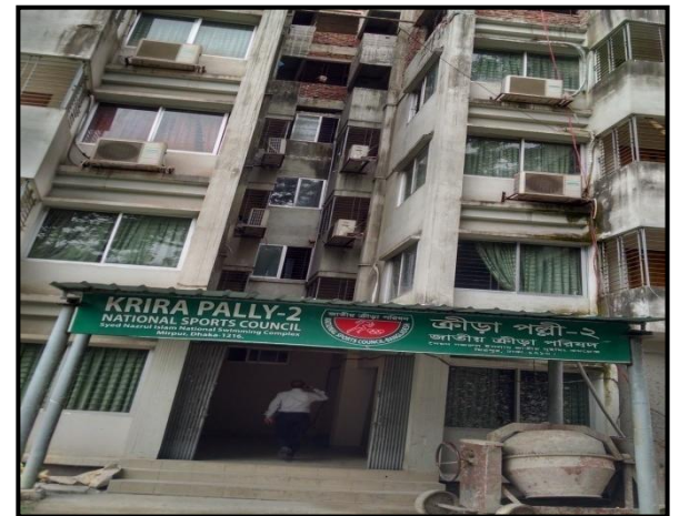
চিত্রঃ মিরপুরস্থ ক্রীড়া পল্লী-২ এর আপগ্রেডেশন কাজের অংশবিশেষ।