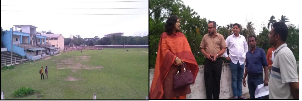
চিত্রঃ জামালপুর জেলা স্টেডিয়ামে বিদ্যমান প্যাভিলিয়ন ভবন এবং স্টেডিয়াম পরিদর্শনকালে সংশ্লিষ্টদের সাথে ।