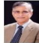
ড. শামসুল আলম মাননীয় প্রতিমন্ত্রী, পরিকল্পনা মন্ত্রণালয়