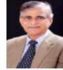
ড. শামসুল আলম মাননীয় প্রতিমন্ত্রী, পরিকল্পনা মন্ত্রণালয়