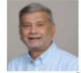
এম এ মামুন, এমপি মাননীয় মন্ত্রী, পরিকল্পনা মন্ত্রণালয়