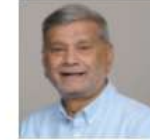
এম এ মান্নান, এমপি মাননীয় মন্ত্রী, পরিকল্পনা মন্ত্রণালয়