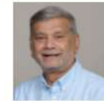
এম এ মামুন, এমপি মাননীয় মন্ত্রী, পরিকল্পনা মন্ত্রণালয়