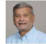
এম এ মানান, এমপি মাননীয় মন্ত্রী, পরিকল্পনা মন্ত্রণালয়