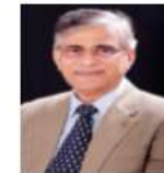
ড. শামসুল আলম মাননীয় প্রতিমন্ত্রী, পরিকল্পনা মন্ত্রণালয়