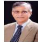
ড. শামসুল আলম মাননীয় প্রতিমন্ত্রী, পরিকল্পনা মন্ত্রণালয়