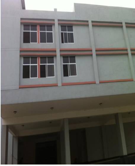
আদমজী ইপিজেডে নির্মিত ভবনের একাংশ

আদমজী ইপিজেড অংশ: গত ২৩/০২/২০১৬ তারিখ আদমজী ইপিজেড অংশ সরেজমিনে পরিদর্শন করা হয়। পরিদর্শনকালীন সময়ে সংশ্লিষ্ট ইপিজেড এর মহাব্যবস্থাপক সহ প্রকল্প সংশ্লিষ্ট কর্মকর্তাগণ উপস্থিত থে কে পরিদর্শন কাজে সহায়তা করেন। পরিদর্শনকালে জানা যায় যে, একটি ভবন বিদেশী বিনিয়োগকারীর নিকট ভাড়া দেয়া হয়েছে। অন্য ভবনটির ভাড়ার জন্য চুক্তি সম্পাদনের অপেক্ষায় রয়েছে। তবে ভবন দুটি দীর্ঘদিন ধরে খালি অবস্থায় ছিল। ভবন দুটির কাঠের দরজা উন্নতমানের না হওয়ায় বিভিন্ন জায়গায় ফাক হয়ে রয়েছে এবং বাথরুমের দরজাগুলি প্লাস্টিকের ভাল মানের হয়নি বলে প্রতীয়মান হয়েছে। এছাড়া ইলেকট্রিক্যাল কাজের সুইচসহ সুইচ বোর্ড গুলি নিম্নমানের বলে মনে হয়েছে। প্রকল্পের অধিকাংশ ক্রয়কার্যে উন্মুক্ত দরপদ্ধতি অনুসরণ করা হয়েছে।