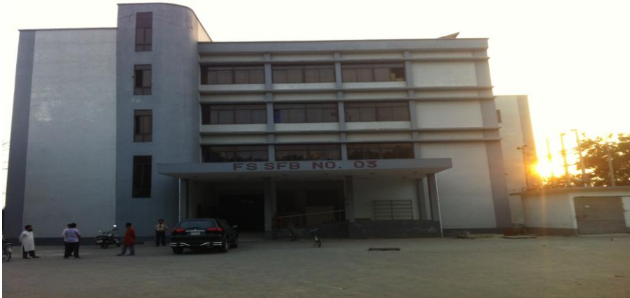
সৈয়দপুর ইপিজেডে নির্মিত ভবন

সৈয়দপুর ইপিজেড অংশ: গত ২৩/০৪/২০১৬ তারিখ সৈয়দপুর ইপিজেড অংশ সরেজমিনে পরিদর্শন করা হয়। পরিদর্শনকালীন সময়ে সংশ্লিষ্ট ইপিজেড কর্তৃপক্ষ উপস্থিত থেকে পরিদর্শনকাজে সহায়তা করেন। এ ফ্যাক্টরী বিল্ডিং এর জন্য মোট বরাদ্দ ছিল ১২১৫.২০ লক্ষ টাকা যার মধ্যে ব্যয় করা হয়েছে ৯৯২.৫৭ লক্ষ টাকা। অর্থাৎ মোট বরাদ্দের চেয়ে ২২২.৬৩ লক্ষ টাকা কম খরচ করা হয়েছে। পরিদর্শনকালে জানা যায় যে, ভবনটি নির্মাণের পর পরই এভার গ্রীন নামক বিদেশী কোম্পানীর নিকট তিন বছরের জন্য সম্পূর্ণ ভবনটি ভাড়া দেওয়া হয়েছে। ভবনের প্রতি বর্গমিটার এর মাসিক ভাড়া ২.৭৫ ডলার। এ ইপিজেড এলাকায় পর্যাপ্ত শ্রমিক পাওয়া যায় বিধায় কোন ফ্যাক্টরী বিল্ডিং খালি নেই। সহজে শ্রমিক পাওয়ার জন্য এ ইপিজেডে বিদেশী ইন্ভেস্টরদের ফ্যাক্টরী বিল্ডি ভাড়া ও লীজ নেয়ার চাহিদা বেশী বলে পরিদর্শনকালে জানা যায়। তাছাড়া সম্পূর্ণ ইপিজেড ঘুরে দেখা যায় যে এখানে ইন্ভেস্টরদের জন্য সব ধরনের সুযোগ সুবিধা রয়েছে। বিল্ডিং নির্মাণের সাথে সাথে ভবন থেকে রাজস্ব আয় হওয়ার এ ইপিজেড এর ফ্যাক্টরী বিল্ডিংটি নির্মাণের উদ্দেশ্য সফল হয়েছে বলে পরিদর্শনকালে প্রতীয়মান হয়।