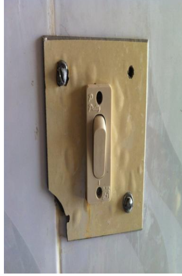
নিম্নমানের সুইচ বোর্ড