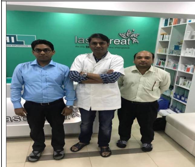
চিত্র-৩: চিত্রে বাংলাদেশ ব্যাংক থেকে ঋণ গ্রহণকারীদের সাথে প্রকল্প পরিদর্শনকারী কর্মকর্তা।