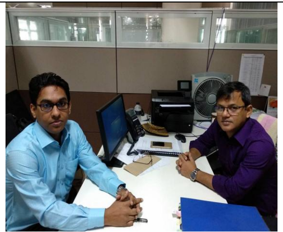
চিত্র-২: চিত্রে এসএমই এন্ড স্পেশাল প্রোগ্রামস বিভাগের যুগ্ম পরিচালকের সাথে প্রকল্প পরিদর্শনকারী কর্মকর্তা।