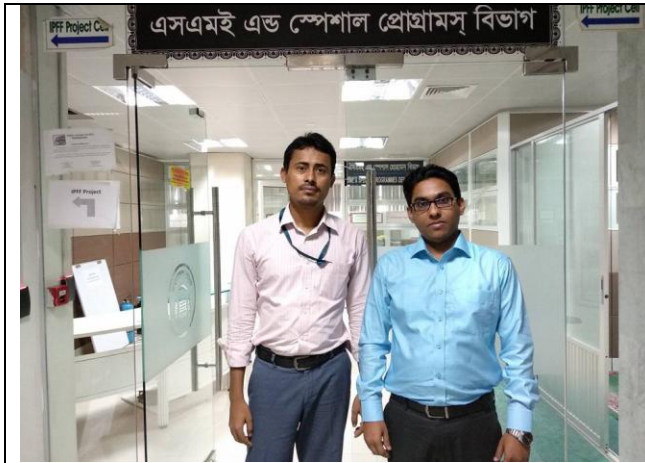
চিত্র-১: চিত্রে প্রকল্প কর্মকর্তার সাথে প্রকল্প পরিদর্শনকারী কর্মকর্তা।

১১। পরিদর্শনকৃত বিভিন্ন অংগ ভিত্তিক অগ্রগতি এই প্রকল্পের আওতায় বাংলাদেশ ব্যাংক ৪৬ টি ব্যাংক ও আর্থিক প্রতিষ্ঠান কে ৫% হারে ঋণ দিয়েছে। এই ৪৬ টি ব্যাংক ও আর্থিক প্রতিষ্ঠান ক্ষুদ্র ও মাঝারি ৫২৬ টি প্রতিষ্ঠানের অনুকূলে বিভিন্ন সুদের হারে ঋণ বিতরণ করেছে।