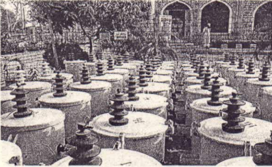
চিত্র-১: পল্লী বিদ্যুতায়ন সম্প্রসারণ ঢাকা বিভাগীয় কার্যক্রম-II এর অধীনে মুন্সিগঞ্জ পবিসের জন্য সংগৃহীত ট্রান্সফরমার।

১০। প্রকল্প সংশ্লিষ্ট স্থির চিত্র: প্রকল্প সংশ্লিষ্ট ২(দুই)টি স্থির চিত্র নিয়ে প্রদান করা হলো:-