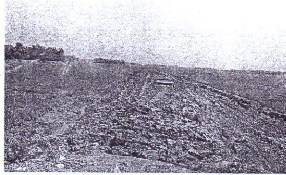
চিত্র-৩: গাজীপুর, জয়দেবপুরের শশমানঘাট এলাকায় গ্যাস সঞ্চালন পাইপ লাইনের মাটি কাটার কাজ চলমান আছে