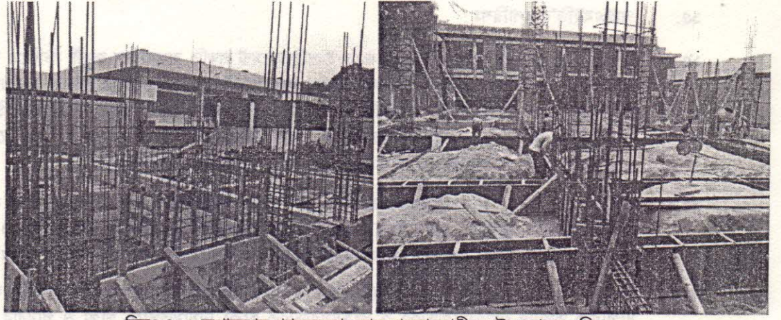
চিত্রঃ ৪, ৫-অপারেশন প্ল্যানের আওতায় বাস্তবায়নধীন ভৌত কাজের চিত্র।