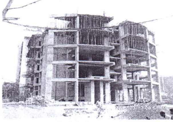
ছবি : নির্মাণাধীন BEC ভবন

১১.৩ বাস্তবায়ন অগ্রগতি : পরিদর্শনের দিন পর্যন্ত ৫ম তলার ছাদ ঢালাই করার কাজ সম্পন্ন হয়েছে পরিলক্ষিত হয়েছে এবং বেইজমেন্টে অবস্থিত অডিটোরিয়ামের পেরিফেরিয়াল ওয়ালের ঢালাই কাজ চলছে মর্মে অবহিত করা হয়েছে। আগামী জুলাই, ১৫ মাস নাগাদ সর্বশেষ ছাদ ঢালাইয়ের কাজ সম্পন্ন হবে মর্মে প্রকল্প পরিচালক আশাবাদ ব্যক্ত করেন।