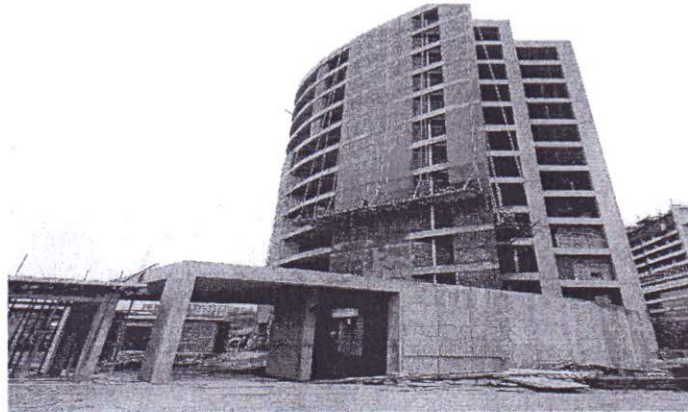
ছবি : নির্মাণাধীন ETI ভবন

প্রকল্পের নির্মাণাধীন দু'টি ভবনের মধ্যে Election Training Institute (ETI) ভবনের নির্মাণ কাজ অনেকাংশে এগিয়ে আছে। ভবনটির ১২ তলার ছাদ, লিফট মেশিনরুম ও ওভারহেড ওয়াটার ট্যাংক এর ঢালাই কাজ সম্পন্ন হয়েছে মর্মে পরিদর্শনের দিন প্রকল্প পরিচালক অবহিত করেছেন। ভবনের বাইরে এবং ভেতরে প্লাস্টার ওয়ার্ক চলমান। অর্থাৎ স্থাপত্য কাজ সম্পূর্ণ শেষ। বর্তমানে স্যানিটারী এবং অভ্যন্তরীণ বিদ্যুৎ সংযোগের কাজ চলছে। অচিরেই ভবনের ইন্টেরিয়র ডিজাইনের কাজ শুরু করা হবে এবং একাজ স্থাপত্য অধিদপ্তর কর্তৃক করা হবে বলে জানা গেছে।