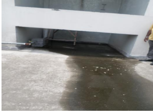
চিত্র নং-২: ছাদের উপর এসি'র পানি জমা থাকা