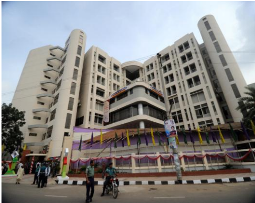
চিত্র নং-৩: ইনস্টিটিউটের সম্মুখ অংশ