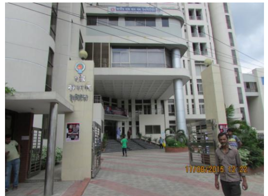
চিত্র নং-৪: ইনস্টিটিউটের সম্মুখ অংশ