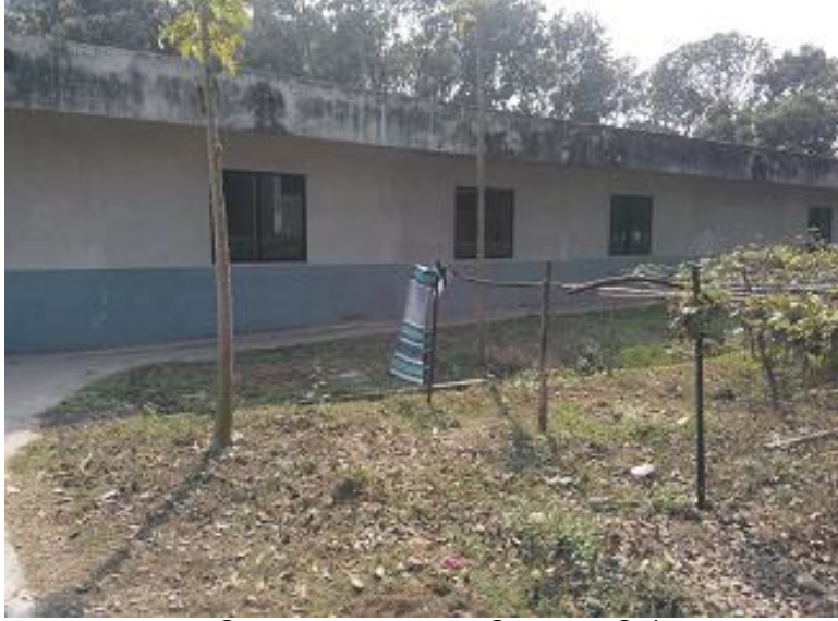
পোলট্রি সেডকে সংস্কার করে প্রশিক্ষণ কক্ষ নির্মাণ