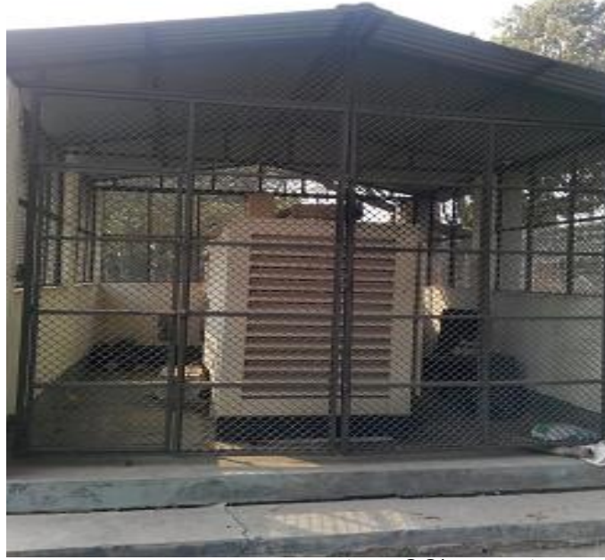
প্রকল্পের আওতায় ক্রয়কৃত জেনারেটর ও নির্মিত জেনারেটর

১৪.৫ জেনারেটর ক্রয়: প্রকল্পের আওতায় ১টি ৬০ কেভিএ জেনারেটর ক্রয়ের জন্য ১০.৬০ লক্ষ টাকা আরটিপিপি সংস্থানের বিপরীতে ব্যয়ের পরিমাণ পিসিআরে উল্লেখ নেই। তবে পরিদর্শনের সময় ৬০ কেভিএ'র একটি জেনারেটর পাওয়া গিয়েছে এবং এটি সচল বলে জানা গিয়েছে।