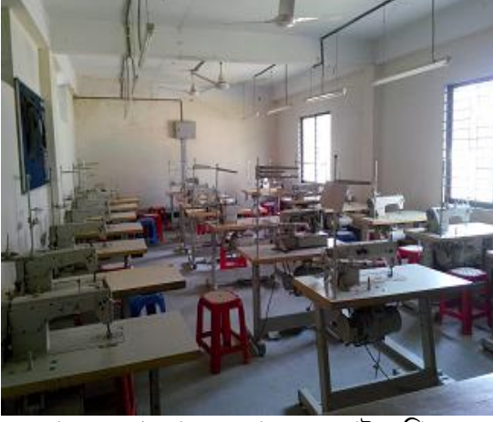
প্রকল্পের আওতায় সরবরাহকৃত সেলাই মেশিন