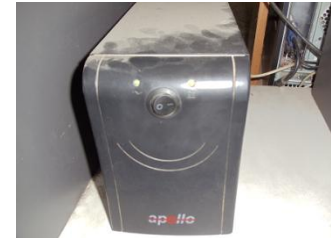
রাজশাহী জেলায় প্রশিক্ষণ কেন্দ্রে নষ্ট UPS

১৬.৩ প্রশিক্ষার্থীর তথ্য সংরক্ষণ সম্পর্কিতঃ প্রকল্পের আওতায় যারা প্রশিক্ষণ গ্রহণ করেছে তাদের তথ্য সম্পর্কিত কোন ডাটা উক্ত কেন্দ্রে সংরক্ষণ নেই যা ,অত্যন্ত জরুরি। প্রশিক্ষার্থীদের ডাটা সংরক্ষণ করা সম্ভব হলে প্রকল্পটি নারীর ক্ষমতায়নকর্মসংস্থান বা দারিদ্র-আত্ম ,্য বিমোচনের ক্ষেত্রে কতটুকু ভূমিকা পালন করেছেতা যাচাই করা বা , প্রকল্পেরImpact যাচাই করা সহজ হবে।