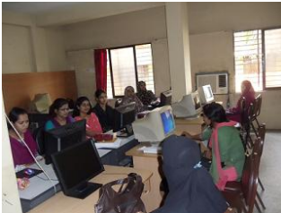
রাজশাহী জেলার প্রশিক্ষণ কেন্দ্রে কয়জন প্রশিক্ষার্থী

১৬.২ প্রশিক্ষণ উপকরণ সম্পর্কিতঃ পরিদর্শনের সময় ৩টি জেলাতেই কিছু না কিছু প্রশিক্ষণ উপকরণ নষ্ট পাওয়া গিয়েছে। যেমনঃ রাজশাহী জেলায় ১ম ও ২য় পর্যায়ে প্রাপ্ত ২০টি কম্পিউটারের মধ্যে ০৯টি ব্যবহার অনুপযোগী। ফলে কিছু কিছু কম্পিউটার ২ জন প্রশিক্ষার্থী শেয়ার করেছে। এক্ষেত্রে প্রশিক্ষণের কোন সমস্যা হয়নি বলে সংশ্লিষ্ট প্রশিক্ষক জানান। তবে প্রত্যেক প্রশিক্ষার্থীর জন্য একটি কম্পিউটার বরাদ্দ থাকলে আরও মানসম্পন্ন প্রশিক্ষণ নিশ্চিত করা যেত। এছাড়া রাজশাহী কেন্দ্রের ১৫টি UPS, মাল্টিমিডিয়া প্রজেক্টর )Color problem;( খুলনা কেন্দ্রে ১৮টি কম্পিউটারের মধ্যে ২টি কম্পিউটার টি১২ ,UPS, কিছু আসবাবপত্র এবং চট্টগ্রাম কেন্দ্রে ২১টি কম্পিউটার টি ৩০) টি২২ ,(কম্পিউটারের মধ্যেUPS (টি ইউপিএসের মধ্যে৩৪), মাল্টিমিডিয়া প্রজেক্টরটি ব্যবহার অনুপযোগী।