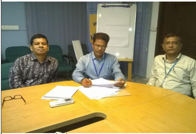
আইএলও কর্মকর্তাদের সাথে প্রকল্পের তথ্য যাচাই