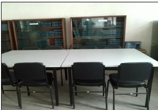
টংগী আইআরআই-এ সরবরাহকৃত লারেরী ফার্ণিচার