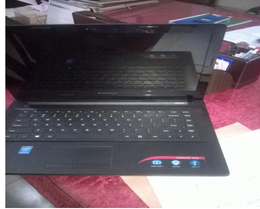
টংগী আইআরআই-এ সরবরাহকৃত ল্যাপটপ