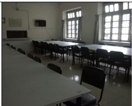
টংগী আইআরআই-এর ডাইনিং রুমে সরবরাহকৃত ফার্ণিচার