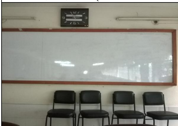
টংগী আইআরআই-এ সরবরাহকৃত প্রজেক্টর স্ক্রিন কাম হোয়াইট বোর্ড