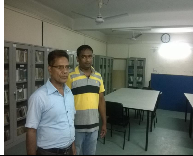
খুলনা আইআরআই-এর লাইব্রেরীত সরবরাহকৃত ফার্ণিচার