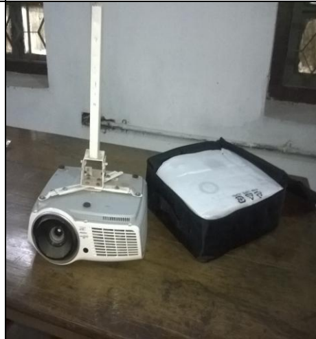
টংগী আইআরআই-এ সরবরাহকৃত প্রজেক্টর