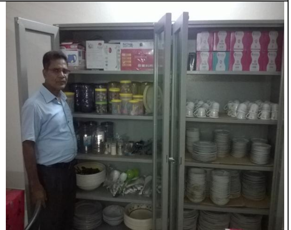
খুলনা আইআরআই-এ সরবরাহকৃত ফ্রোকারিজ ও ক্যাটারিং