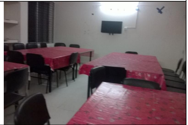
খুলনা আইআরআই-এর ডাইনিং রুমে ব্যবহৃত ফার্ণিচার ও টিভি