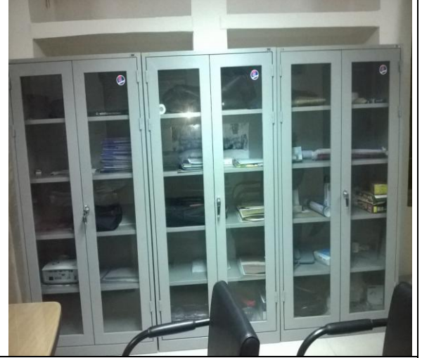
খুলনা আইআরআই-এর অফিস কক্ষে ব্যবহৃত সেলফ