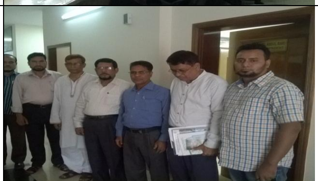
বাংলাদেশ ফ্রোজেন ফুড এক্সপোর্টস এসোসিয়েশন, খুলনা-এর কর্মকর্তা ও সদস্যবৃন্দের সাথে আলোচনা ও মতবিনিময়