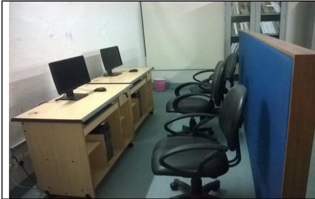
খুলনা আইআরআই-এ সরবরাহকৃত কম্পিউটার সেট