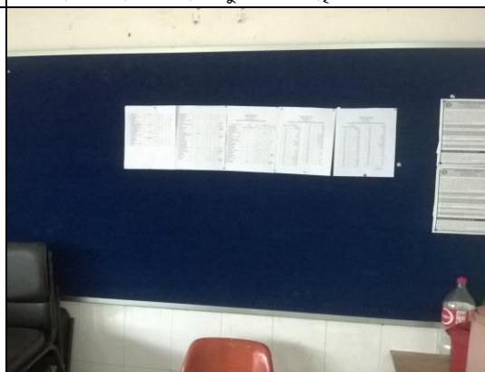
টংগী আইআরআই-এ সরবরাহকৃত ট্যাগ পিন নোটিশ বোর্ড