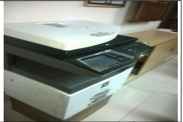
খুলনা আইআরআই-এ সরবরাহকৃত ফটোকপিয়ার