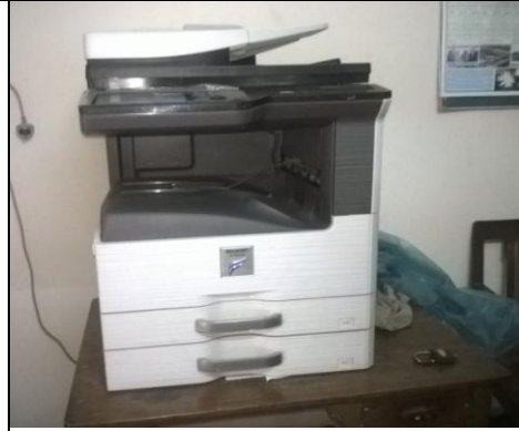
টংগী আইআরআই-এ সরবরাহকৃত ফটোকপিয়ার