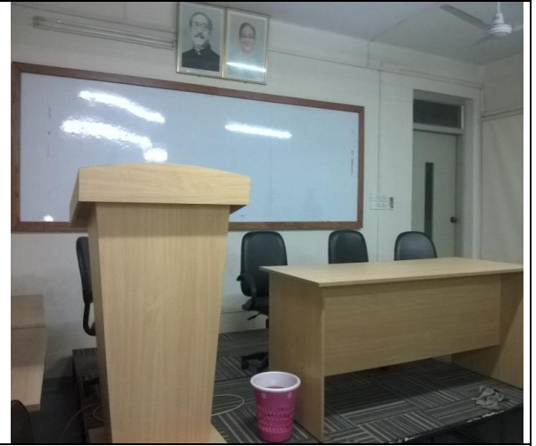
খুলনা আইআরআই-এর ট্রেনিংরুমে সরবরাহকৃত ফার্ণিচার