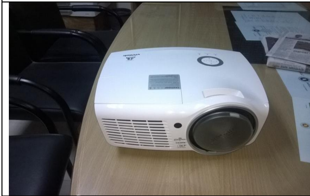
খুলনা আইআরআই-এ সরবরাহকৃত প্রজেক্টর