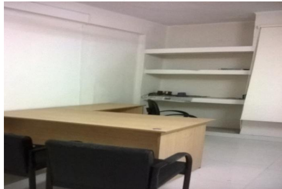
সংস্কারকৃত লাইব্রেরীয়ানের রুম