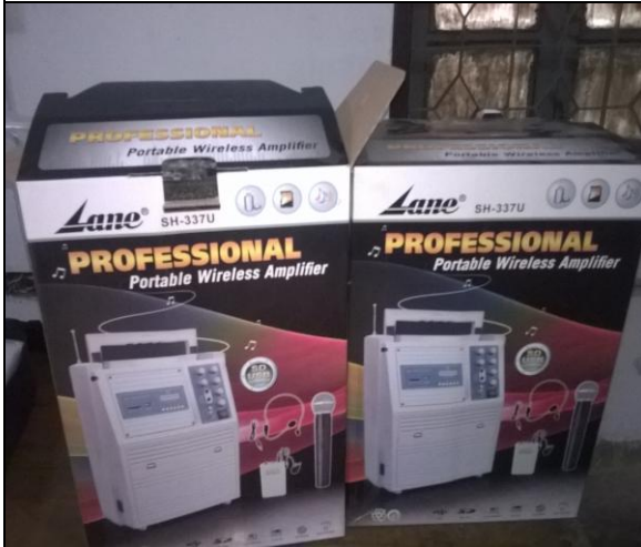
টংগী আইআরআই-এ সরবরাহকৃত লাউট স্পিকার