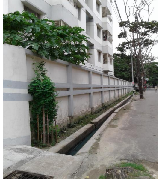
ছবি ৪. চারদিক বেষ্টিত ওয়াল