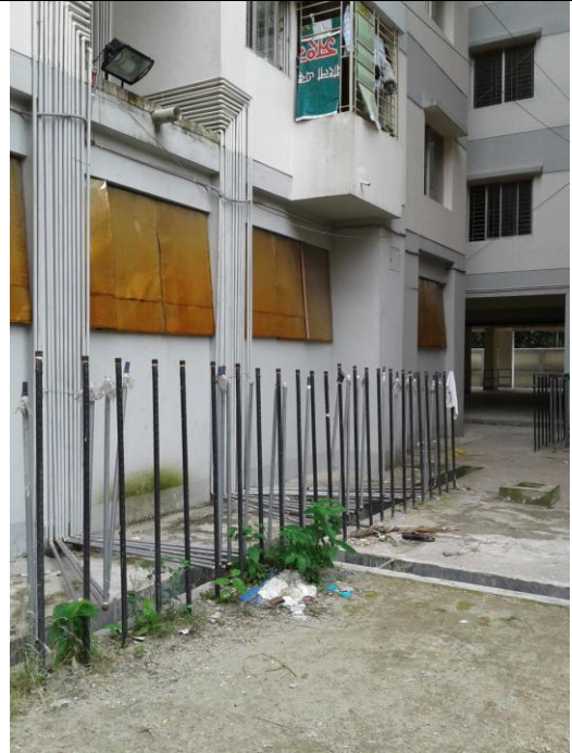
ছবি-১০: গ্যাস লাইন ব্যবহৃত হচ্ছেনা