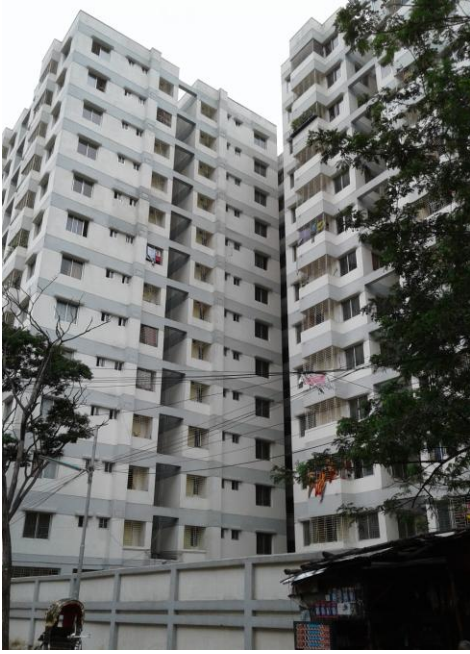
ছবি: ১. ১০০০ বর্গ ফুট বিশিষ্ট বिल्ডিং এর সাউথ-ইস্ট ফেস।

১২.৫ প্রকল্প আওতায় নির্মিত স্থাপনার কতিপয় স্থিরচিত্রঃ