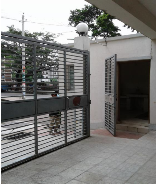
ছবি- ৫: সিকিউরিটি গার্ডরুম ও গেটের দৃশ্য গাড়ী পার্কিং এরিয়া