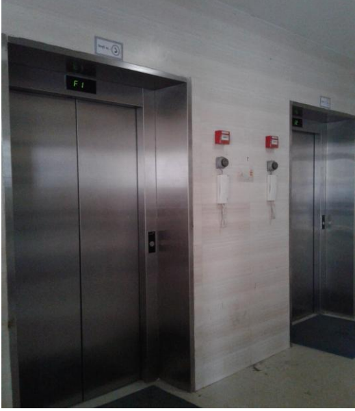
ছবি: ৩. লিফটের বাহিরের দিক