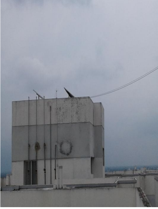
ছবি-৭: সোলার প্লান্ট ও আর্থিং সহ বজ্রপাত নিরোধক