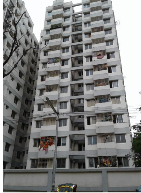
ছবি ২. ৬০০ বর্গফুট বিশিষ্ট বिल्ডিং এর সাউথ ফেস।