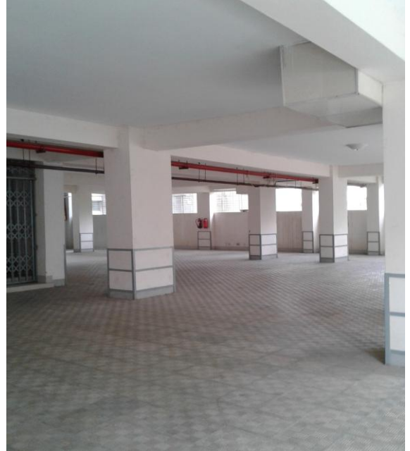
ছবি ৬: বিল্ডিং এর নিছ তলায় সুবিশাল গাড়ী পার্কিং এরিয়া