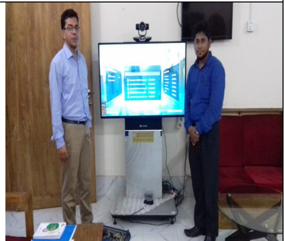
চিত্র: সদর উপজেলা, রাঙ্গামাটি।