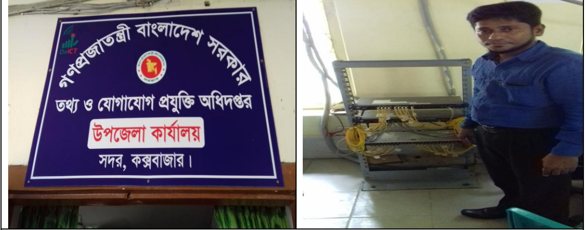
চিত্র: কক্স-বাজার সদর উপজেলা।