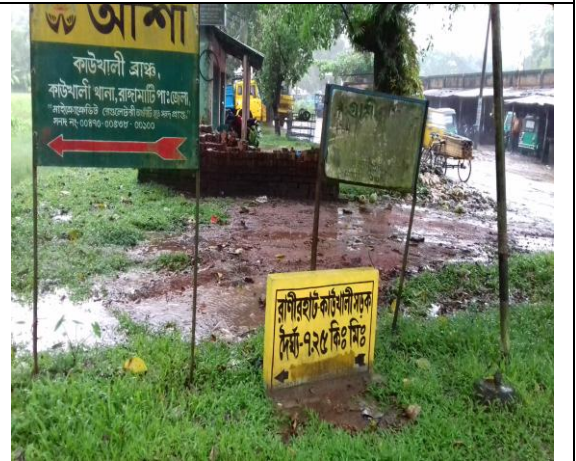
চিত্র: কাউখালী উপজেলা, রাঙ্গামাটি।