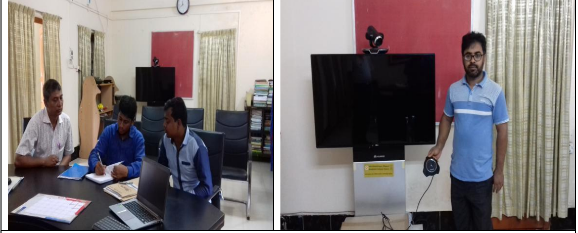
চিত্র: কক্স-বাজার সদর উপজেলা।

প্রকল্প সংশ্লিষ্ট কর্মকর্তাগণ এবং অন্যান্য সংশ্লিষ্ট কর্মকর্তাগণের সহিত আলোচনা করা হয়েছে। সরেজমিনে পরিদর্শন ও প্রকল্প সমাপ্ত প্রতিবেদন (পিসিআর) হতে প্রাপ্ত তথ্যের ভিত্তিতে মূল্যায়ন প্রতিবেদনটি প্রণয়ন করা হয়েছে।