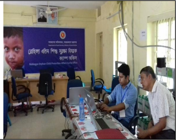
চিত্র: উখিয়া উপজেলা, কপ্তাবাজার।