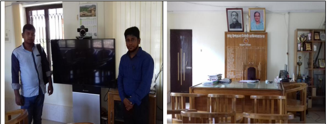
চিত্র: রামু উপজেলা, কক্স-বাজার।